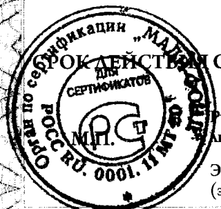
схема сертификации 1с, срок службы и условия хранения продукции согласно документации изготовителя